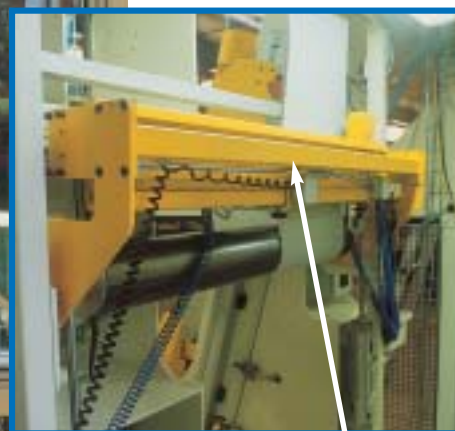
Table en position de collage